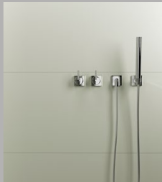
White&Glass Ivory 40x120 (16"x48")